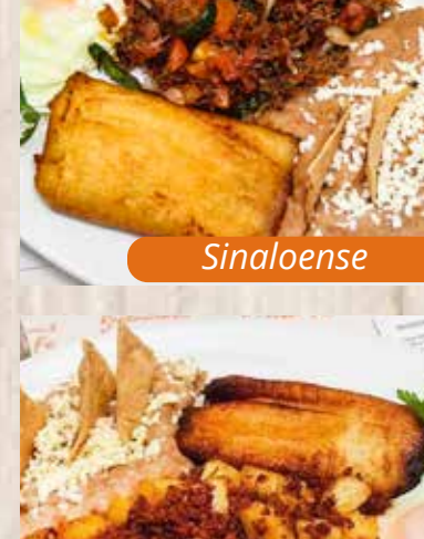
Chorizo con sopitas