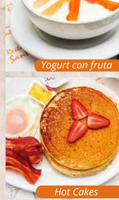
Yogurt con fruta