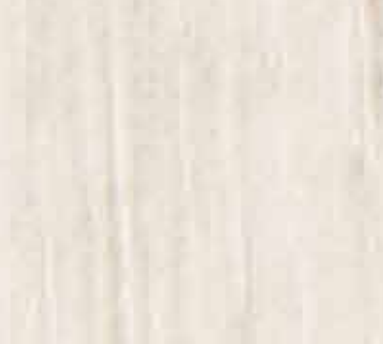
Hamburguesa Santa Fe